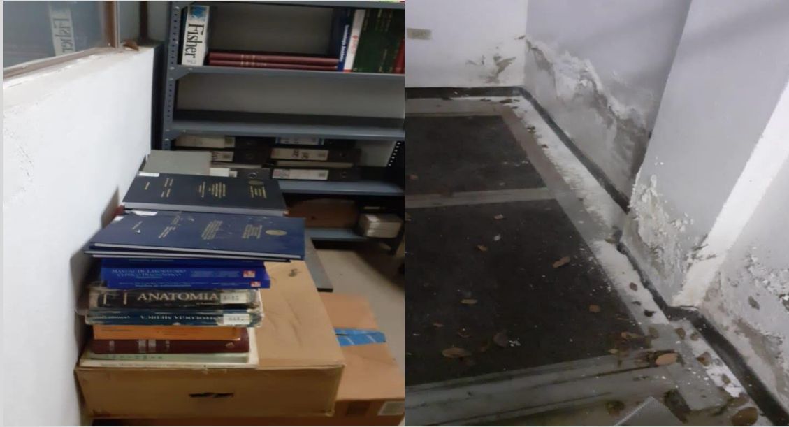
Imágenes del mal estado de la biblioteca del 12 de marzo de 2022.