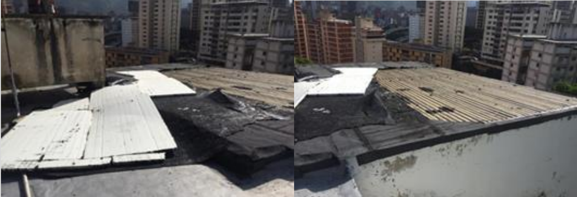
Daños en techos por filtraciones en el CENDES - UCV. Fecha: enero de 2022.

177. El CENDES - UCV está ubicado fuera del campus de la UCV y presenta filtraciones en techo y paredes, por la falta de impermeabilización; humedad y proliferación de bacterias en el material bibliográfico; robo de equipo de computación y falta de vigilancia 174 .