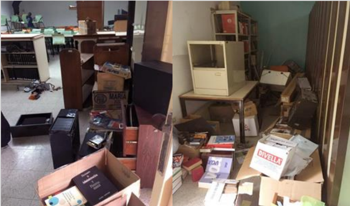
Imágenes de la Biblioteca de Idiomas Modernos de la UCV. Fecha: noviembre de 2021.