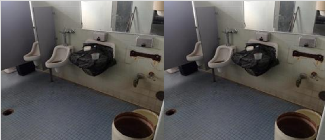
Biblioteca Central de la UCV con una tubería en mal estado y filtraciones