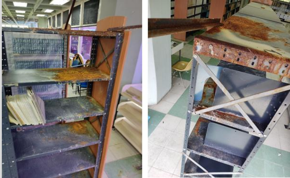
Estado de la estantería de la BIACI producto de las filtraciones de los techos.