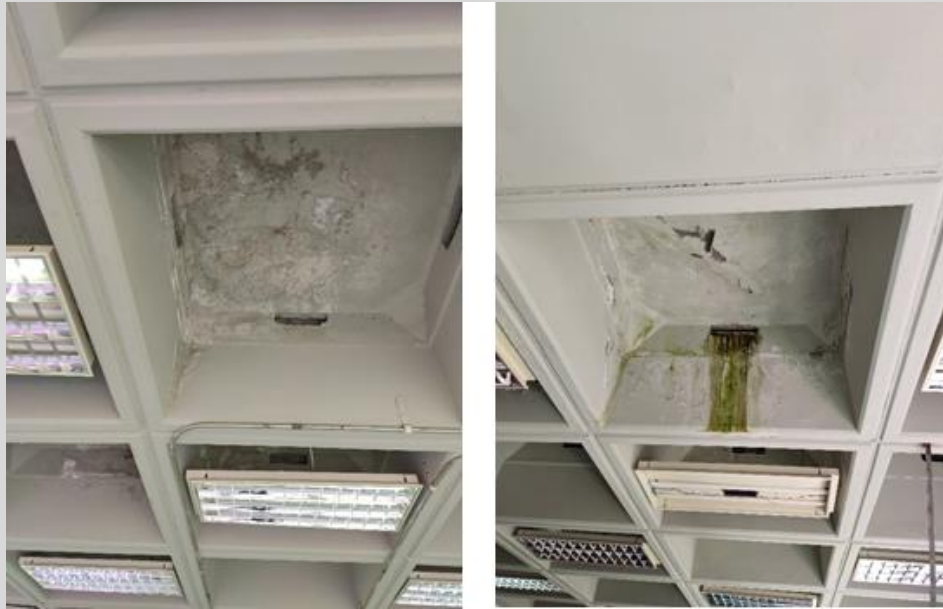
Filtración en los techos de la BIACI producto de la desinversión en infraestructura y mantenimientos.